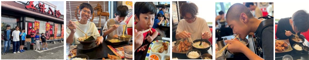
ポテンシャルでの様子1

♣ 外食レクは、皆の大好きなラーメンを五味八珍に行き食べました。注文する時は、ちょっと緊張しましたが、きちんと店員さんに伝える事ができました。